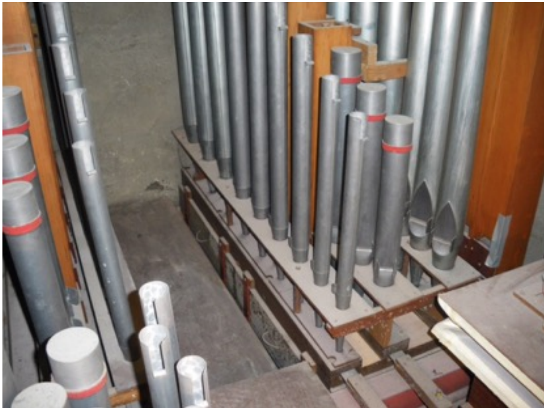
C en Cis-lade van het Pedaal met links op de voorgrond de lade voor de toegevoegde tonen f-f 1 .